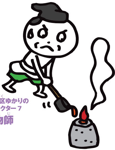
すみよし 住吉区ゆかりのキャラクター7 鑄物師