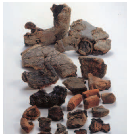
海を航行する船の目印の役割をはたしていた住吉高燈籠（住之江区）。右は苺田4丁目出土した鑄物づくりの道具