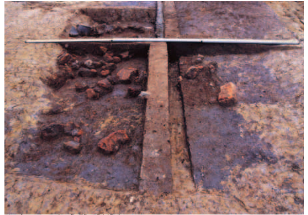
はつくつ ちゅうぞうこうぼうしせつ 発掘された鑄造工房施設