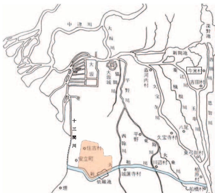
新大和川・十三間川の配置図

新しい川ができたので、古い大和川のまわりでは洪水の心配はなくなりましたが、住吉区では農業用に水を貯めていた依網池が新しい川で分断されて小さくなり、池の底が川の底より浅くなったため農業には使えなくなってしまいました。