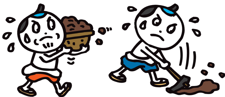
住吉区ゆかりのキャラクター 10 大和川の工事人

その一方で、新しい川には剣先船と呼ばれる荷物運ぶ船が航行するようになり、南北の十三間川を使って大阪と奈良を結ぶ新たな水運が開かれました。