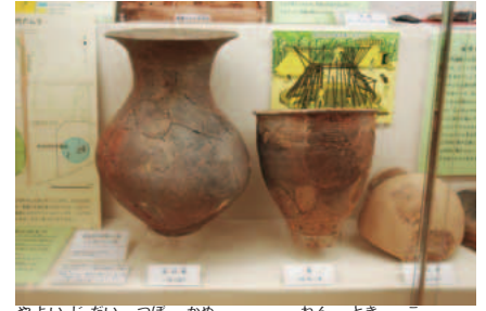
弥生時代の壺や甕。2,000年の時を越えて