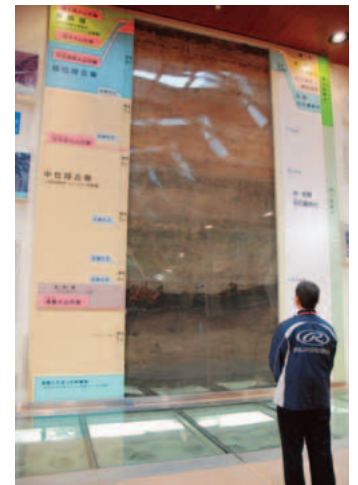
この辺りの地層は こんなに複雑だった