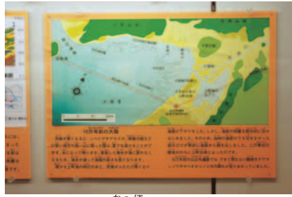
ナウマンゾウが闊歩していたころの 大阪の地図