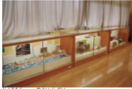
縄 文から弥生時代にかけての 展示コーナー