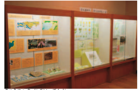
旧 石器時代の展示コーナー