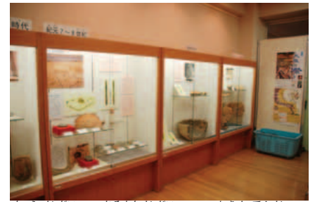
奈良時代から室町時代までの歴史展示