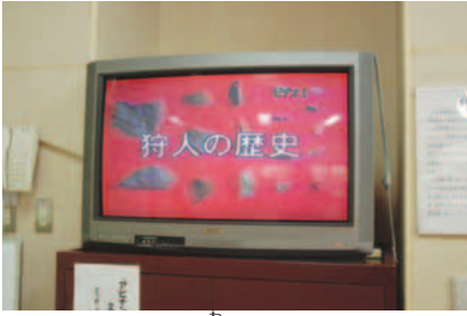
ビデオもあるから分かりやすく 解説してくれる