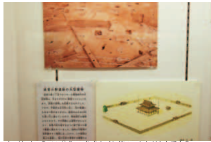
遠里小野遺跡の飛鳥時代の大型建物