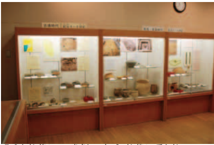
古墳時代から飛鳥・奈良時代の展示