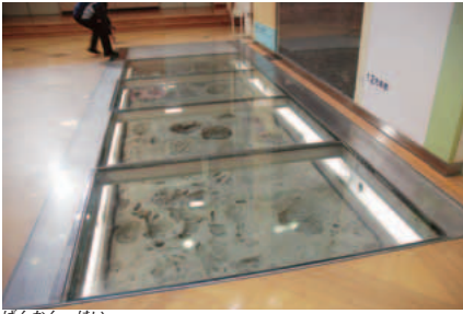
けんかん はい 玄関を入ったところに、 ナウマンゾウの足跡が