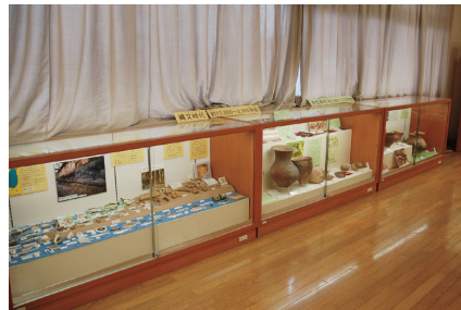
縄 文から弥生時代にかけての 展示コーナー