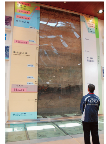
この辺りの地層は こんなに複雑だった