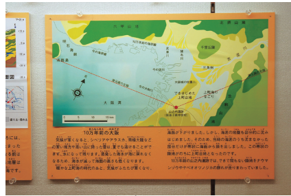
ナウマンゾウが闊歩していたころの 大阪の地図