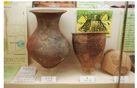
弥生時代の壺や甕。2,000年の時を越えて