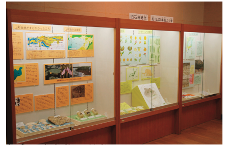
旧 石器時代の展示コーナー