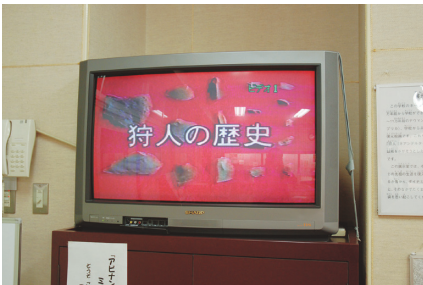
ビデオもあるから分かりやすく 解説してくれる