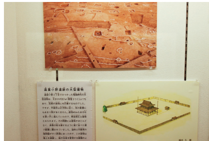
遠里小野遺跡の飛鳥時代の大型建物