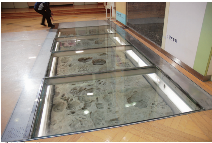
けんかん はい 玄関を入ったところに、 ナウマンゾウの足跡が