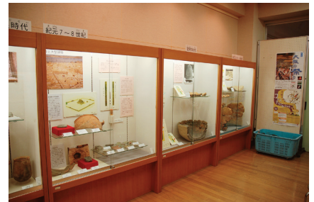
奈良時代から室町時代までの歴史展示