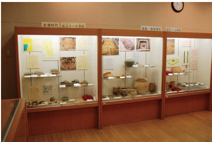
古墳時代から飛鳥・奈良時代の展示