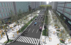
御堂筋の側道歩行者空間化イメージ▶