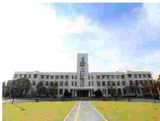
大阪市立大学(杉本キャンパス)