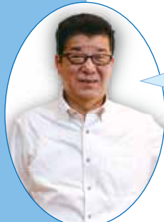
大阪市長 松井一郎

4つの特別区を設置することで、地震や豪雨など、災害発生時の情報収集や被災状況を踏まえた対応をより迅速に行いやすくなります。