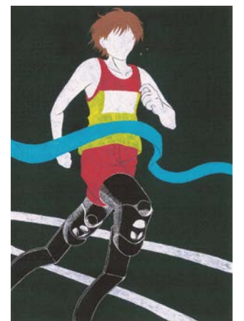
令和元年度 障がい者週間のポスター 中学生部門 最優秀賞作品

障がいのある人とない人との心のふれあいをテーマにした作文またはポスター。対象は市内在住または在学の①小学生以上 ②小・中学生。申込方法など詳しくは HP をご覧ください。