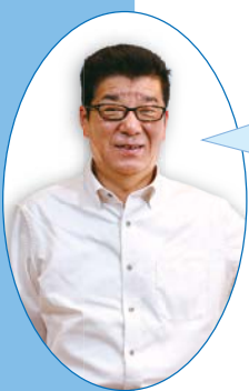
大阪市長 松井一郎

これからの行政は、地域の実情を見て、意見を聴き、施策を実行するニア・イズ・ベターがますます重要になります。