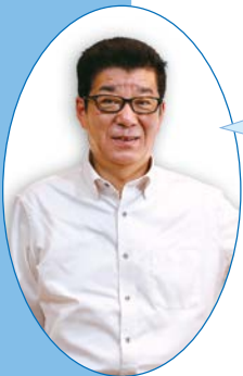
大阪市長 松井一郎

特別区制度では、大阪府と大阪市を再編し、広域機能は大阪府へ一元化し、大阪市をなくし基礎自治体として4つの特別区を設置します。 広域機能の一元化で大阪のさらなる成長と、特別区では地域のニーズに応じた身近な住民サービスの充実をめざします。