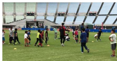
昨年のDo Sports Fes 2019の様子

モデル・女優の中条あやみさんをゲストにお招きし、トップチームのアスリートなどから指導を受けられるサッカーやバスケットボールなど、さまざまなスポーツの体験