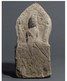
石造 道教三尊像 北魏・延昌四年(515) 大阪市立美術館蔵(山口コレクション)

関西の実業家・山口謙四郎氏より寄贈された作品群「山口コレクション」の中から、中国の石造彫刻を中心に中国南北朝時代(5~6世紀)の仏像・道教像を展示します。