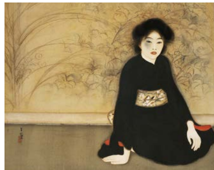
島成園 無題 大正7年(1918) 大阪市立美術館蔵(森本美津子氏寄贈)

大正期の大阪を駆け抜けた女性日本画家・島成園の没後50年にあたり、所蔵する作品を通して彼女の画業を振り返ります。 日 9/5(土)~10/11(日)9:30~17:00(入館は16:30まで)、月曜休館(9/21(月・祝)は開館) 日 大人300円ほか 場 問 市立美術館 ☎ 6771-4874 FAX 6771-4856