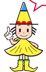
大阪市選挙マスコット「センキョン」

大阪市では、特別区の区割りや名称など、大都市制度(特別区設置)協議会でとりまとめた特別区設置協定書が、大阪市の会と大阪府議会で承認されたことを受け、「大都市地域における特別区の設置に関する法律」に基づき、大阪市を廃止し特別区を設置することについての住民投票が行われることとなりました。