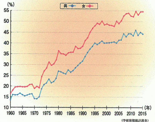
中学1年生の標準視力1.0未満の割合