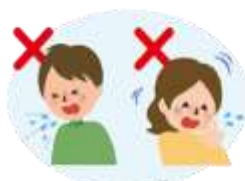
何もせずに咳やくしゃみをする 咳やくしゃみを手でおさえる