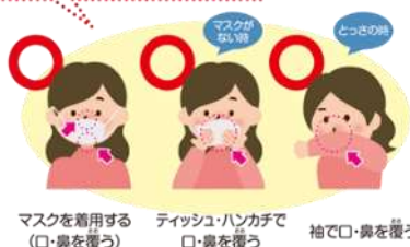
マスクを着用する（口・鼻を覆う） ティッシュ・ハンカチで口・鼻を覆う 袖で口・鼻を覆う