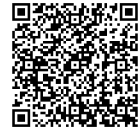
幼稚園保育所等マップ