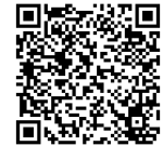
ファミリーサポート センター事業

急な保育ニーズに対応するため、子どもを預けたい方と預かりたい方が地域で助け合うシステムです。