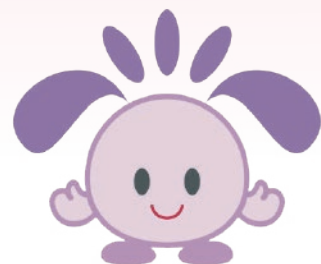
住吉区のマスコット すみちゃん