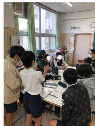
インタビューの様子