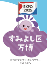
住吉区マスコットキャラクター すみちゃん