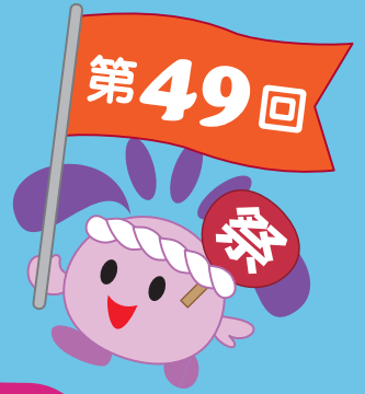
住吉区マスコットキャラクター すみちゃん