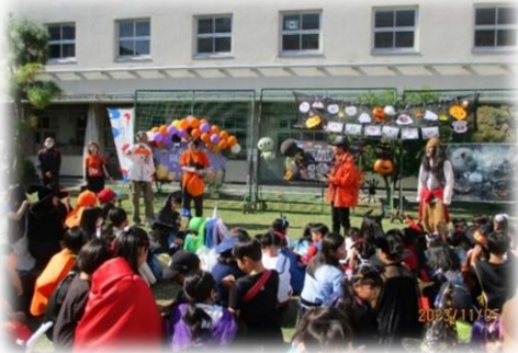
←東粉浜ハロウィンイベント 対話から生まれたイベントは子どもから大人までみんなが楽しめる秋の定番行事に♪年々盛り上がってます

ー「こんなことしてみたい！」「こんな工夫をしてみたらどうか」といった意見を言える場があることで、ワクワクするようなアクションが生れています。皆に少しずつ順番や役割があり、年齢や経験、所属や立場などにとらわれず、「このまちをいいまちにしていきたい」という気持ちでつながる、人の輪が広がっていきます。