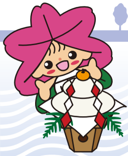
大正区マスコットキャラクター「ツージ」