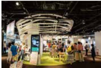
▲多彩な技術やアイデアが集う「ナレッジサロン」や、来場者参加型の展示空間「The Lab.(ザ・ラボ)」では、これまで次世代電気自動車などが商品化されてきました。

問い合わせ 都市計画局うめきた整備担当 ☎6208-7838 FAX6231-3751