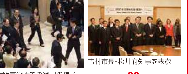
吉村市長・松井府知事を表敬 大阪市役所での歓迎の様子

経済戦略局万博誘致推進室 ☎6615-3036 FAX6615-7433 EXPO2025 検索