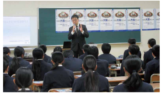
市立南港南中学校での開催風景▶