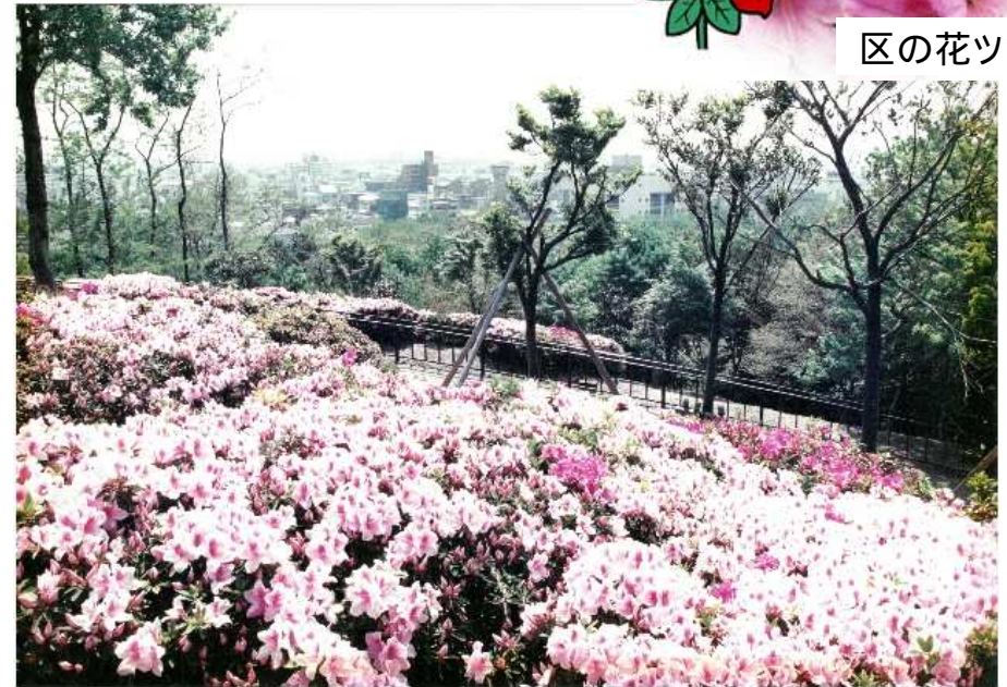
ツツジ咲き誇る昭和山の様子