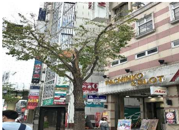
街路樹の被害状況(中央区:御堂筋)