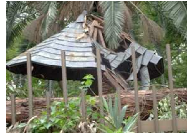
公園施設の被害状況(鶴見区:鶴見緑地)