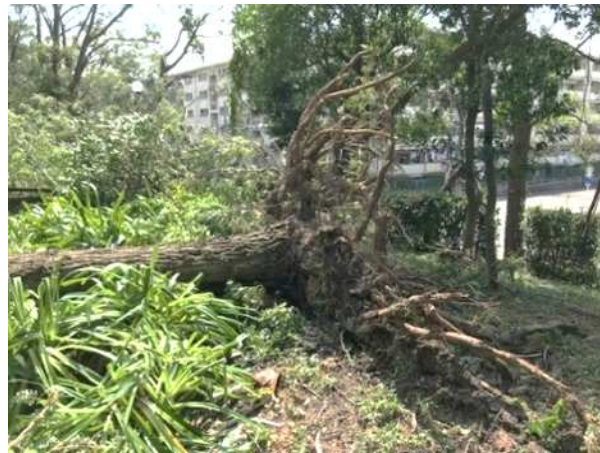
公園樹の被害状況(大正区:千島公園)