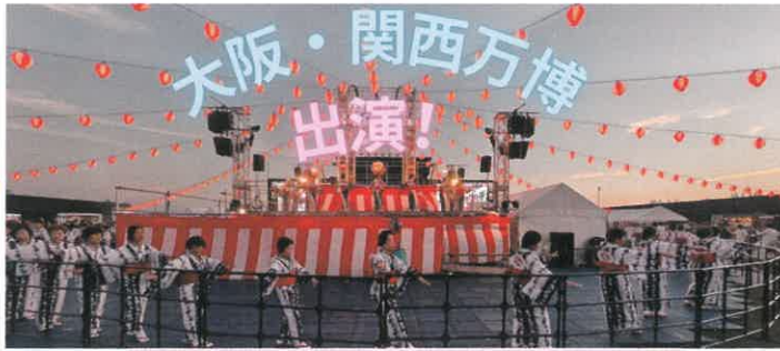
万博の舞台上で、大正区女性会の総踊りを華やかに披露しました