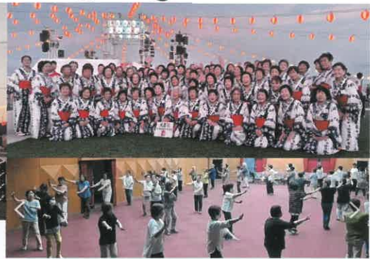
猛暑の中、連日練習に励みました

会員の皆様には、日頃より女性会の活動に積極的に参加・参画いただいておりますことに感謝とともにお礼を申し上げます。