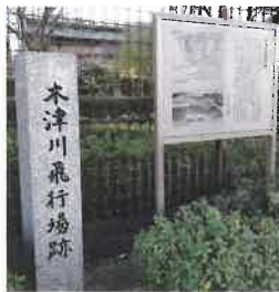
▲ 日本初の公共飛行場跡石碑