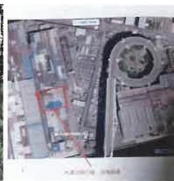
▲ 木津川飛行場上空より旧格納庫