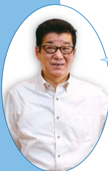
大阪市長 松井一郎

特別区制度では、大阪府と大阪市を再編し、広域機能は大阪府へ一元化し、大阪市をなくし基礎自治体として4つの特別区を設置します。