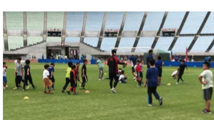
昨年のDo Sports Fes 2019の様子

モデル・女優の中条あやみさんをゲストにお招きし、トップチームのアスリートなどから指導を受けられるサッカーやバスケットボールなど、さまざまなスポーツの体験