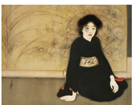
島成園 無題 大正7年(1918) 大阪市立美術館蔵(森本美津子氏寄贈)

大正期の大阪を駆け抜けた女性日本画家・島成園の没後50年にあたり、所蔵する作品を通して彼女の画業を振り返ります。 9/5(土)~10/11(日)9:30~17:00(入館は16:30まで)、月曜休館(9/21(月・祝)は開館) 大人300円ほか 市立美術館 ☎6771-4874 FAX6771-4856