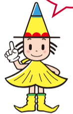
大阪市選挙マスコット 「センキョン」