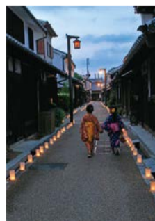
竹内街道・横大路の様子 H27年度フォトコンテスト入選作品 「夕刻のひとこま」 撮影場所: 奈良県橿原市今井町

ウォーキングガイドツアーの動画配信やデジタルスタンプラリーなど、竹内街道・横大路の魅力を楽しめるプログラムをオンラインで開催します。