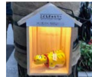
「こどもぎやらりー」のイメージ

☎ 11/3(水・祝)～12/31(金)17:00頃～23:00 ☎ 御堂筋(阪神前交差点～難波西口交差点) ☎ 経済戦略局観光課 ☎ 6469-5166 FAX 6469-3896