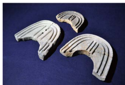
重園文鬼瓦 大阪市教育委員会蔵・大阪市文化財協会保管

発掘調査で見つかった遺跡・遺物と、日本最古の歌集「万葉集」に収められた大阪の歌を通して、飛鳥・奈良時代の難波を照らし出します。