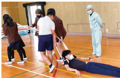
※写真(上下)は、平尾小学校児童が防災訓練に取り組んでいる様子です。

災害の怖さを知ること、自分のことは自分で守り、次への行動に移ることを身をもって知ってもらえれば幸いです。今回の活動を通じて、地域全体の防災意識が少しでも高まればうれしい限りです。