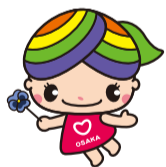
大阪市人権啓発マスコットキャラクター「にっこりな」

地域には病気や障がい、介護、子育てなど配慮や支援などが必要な方がいます。過剰な詮索や本人の承諾を得ずに第三者に情報を伝えることは人権侵害につながります。年度交替を迎え地域の顔ぶれが替わるなか、一人ひとりが地域で快適に暮らせるよう、お互いのプライバシーを尊重しましょう。人権啓発・相談センターでは、専門相談員が人権に関するさまざまな相談をお受けしています(無料・秘密厳守)。☎6532-7830(なやみゼロ)・FAX6531-0666・☑でご相談ください。