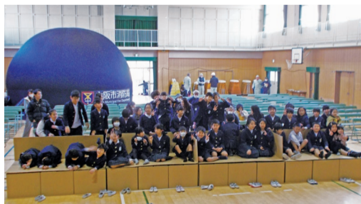
(令和2年の訓練の様子)