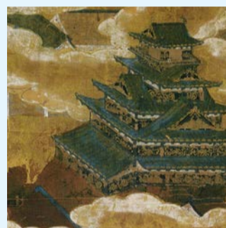
大坂城図屏風(左扇、天守部分)

天守をはじめ、城を構成するさまざまな部分に着目して、豊臣・徳川時代の大坂城の様子を紹介します。 ☎ 7/20(水)まで9:00～17:00(入館は16:30まで) ¥ 入館料:大人600円 場 大阪城天守閣 ☎ 6941-3044 FAX 6941-2197