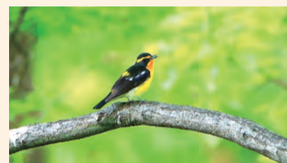
昭和山で撮影したキビタキ

先月から毎月第4日曜日に開催される大正トンポロマルシェでは、ワークショップ『昭和山図鑑』の監修もさせていただきますことになりました。皆さんが撮った昭和山の生き物や植物で図鑑を作ります。ぜひ参加しに来てください!