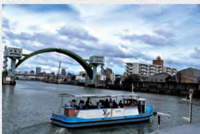
大阪市の渡船 (落合上渡船場)