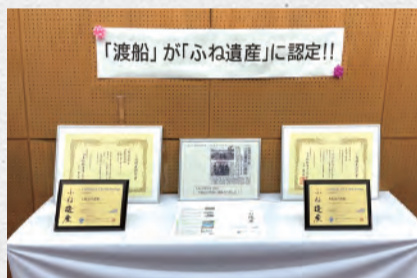
ふね遺産 賞状と盾

【ふね遺産とは】 歴史的、学術的・技術的に価値がある船舶類およびその関連設備を「ふね遺産」として認定し、社会に周知し、次世代に伝えていくと企業や大学の研究者等で構成された、日本船舶海洋工学会が主催するものです。