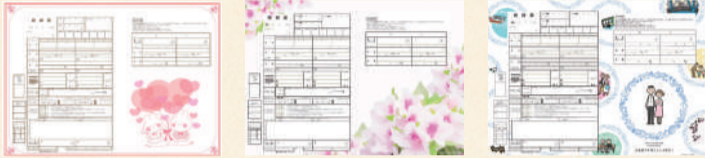
つつじさぎ よろこびのつつじ しあわせの輪

ご結婚という人生の節目を迎えられるお二人を祝福するとともに、大正区に愛着を持っていただき、今後の豊かな生活につなげていただきたいという願いから、オリジナル婚姻届を区役所窓口で配布しています。お二人の記念すべき日に、ぜひご利用ください。