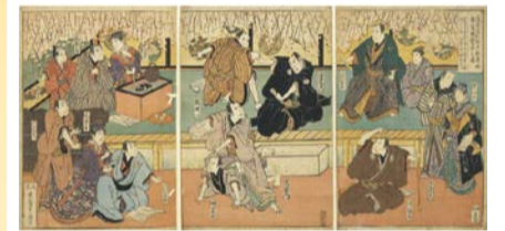
浪花道頓堀大歌舞伎舞台惣稽古之図(南木コレクション) (大阪城天守閣蔵)