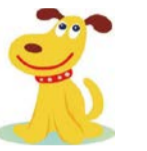
大阪市消費者センター メインキャラクター エルちゃん

「スマホでSNSの広告を見て、化粧品を1回だけのつもりで購入したが、定期購入契約になっていた」などのトラブルが増えています。困ったら、気軽にご相談ください。消費生活相談は市内在住の方に限り、☎・面談(事前予約制)・☑で行っています。