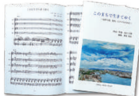
私が制作した楽曲の特製楽譜