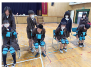
高齢者疑似体験(6年生)

6年生には高齢者疑似体験で身体の不自由さを知ってもらうと共に、視野の制限を体験できるゴーグルとイヤーマフを付けてコースを歩いてもらうことで、子どもたちには想像もできない不便さを知ってもらうことができました。また、大正北中学校の2年生にも認知症サポーター養成講座を行うことができました。そして、小学校と中学校の両方でPTA福祉座談会の開催もでき、保護者の方たちにも大変喜んでいただきました。こうした若い世代に福祉について考えてもらう機会を提供することで、高齢者や障がい者だけでなく、みんなが住みやすい北恩加島のまちづくりにつながると思っています。