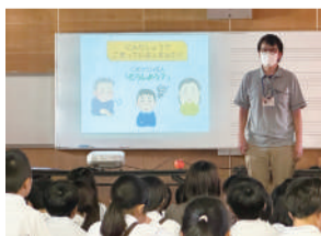
認知症サポーター要請講座(5年生)