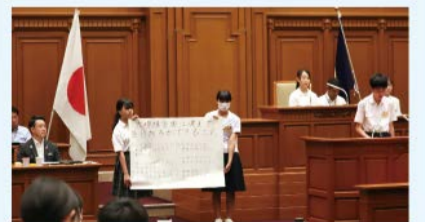
昨年の様子(中学生市会)

市長に質問や提案をするために、議員になってみませんか。対象は市内在住または在学の小学5・6年生。定員81人。 日 8/19(月)14:00～17:00 場 市役所8階 市会本会議場 締 7/8 申 学校で配布される応募用紙(HPにも掲載)に必要事項を書き、学校を通して応募。 問 教育委員会初等・中学校教育担当 ☎06-6208-9186 FAX06-6202-7055