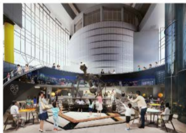
リニューアル後のイメージ 地下1階「アトリウム」

プラネタリウムや体験展示で、科学をわかりやすく伝える電気科学館開館からの歴史をはじめ、新たな展示場や活動を紹介します。 日 8/1(木)～11/24(日)9:30～17:00 (入場は16:30まで)、月曜(祝日の場合は翌平日)休館(8/5・13は開館) 観覧料: 大人400円ほか