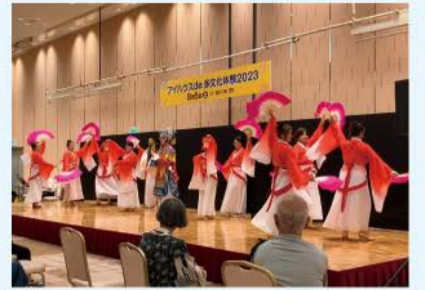
昨年の様子(中国の京劇)

日本在住の外国人による言葉、文化、料理の紹介や、伝統楽器の演奏、踊り、劇などを楽しめるイベントを開催。さまざまな文化への理解を深めましょう。 日 8/3(土)11:00～16:30 場 大阪国際交流センター(天王寺区) 問 (公財)大阪国際交流センター ☎06-6773-8989 FAX06-6773-8421