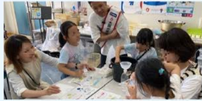
水に関する実験の様子

水に関するワークショップや体験型のイベント、謎解きなどを開催。対象は未就学児～小学生。定員各回70人。 日 ①7/20(土)・21(日)②7/27(土)・28(日) 各日10:00～11:15、12:20～13:35、14:30～15:45 申 ①7/7 ②7/14 各17:00までにHPで。 場 問 水道記念館 ☎06-6320-2874 FAX06-6324-3114