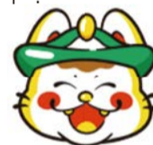
副首都・大阪PRキャラクター 「にやにわ福まる」