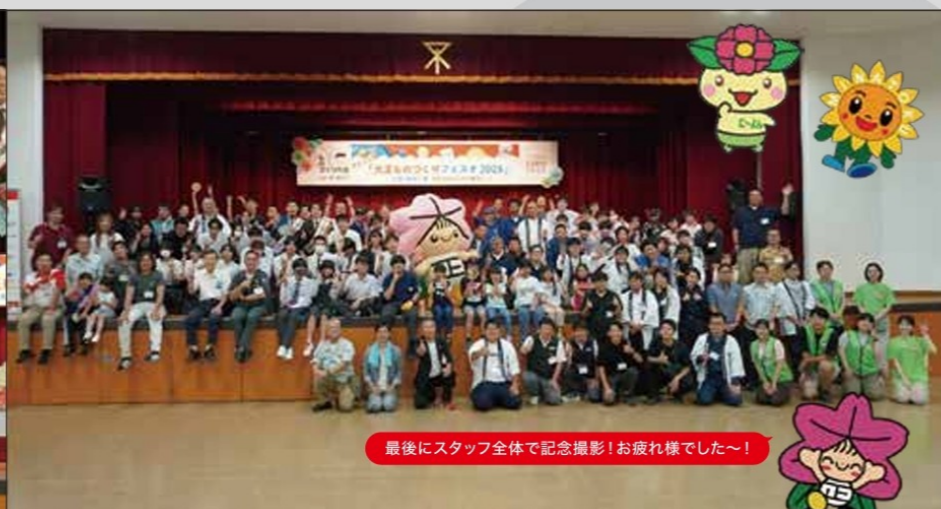
最後にスタッフ全体で記念撮影!お疲れ様でした~!