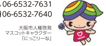
大阪市人権啓発マスコットキャラクター「にっこりな」