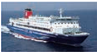
①使用予定船舶「フェリーおおさかⅡ」

大阪港に就航する大型フェリーで、明石海峡大橋を眺めながら大阪湾をめぐるクルーズ。今年は大阪港開港150年を記念して特別に2隻で実施します。船は選べません。定員1500人(2隻計)。小学生以下は保護者同伴。日7/23(日)①11:00~14:30