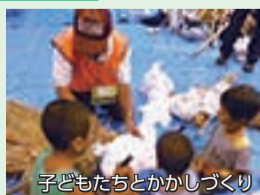
子どもたちとかかしづくり