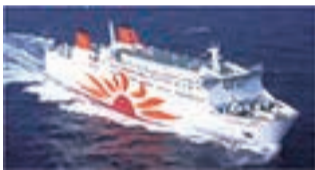
②使用予定船舶「さんぷらわあこぼると」

②11:30~15:00場集合:①大阪南港フェリーターミナル②大阪南港コスモフェリーターミナル申往復ハガキ(6/1から料金変更)で、参加人数(5人まで)・代表者(中学生以上)の住所・氏名・年齢・電話番号を書いて、〒559-0034 住之江区南港北2-1-10 ATC ITM棟10階、港湾局振興課「大阪湾クルーズ」係へ。日6/21問大阪市総合コールセンター☎4301-7285 FAX6373-3302