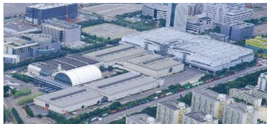
インテックス大阪

各国政府関係者やプレス、スタッフなど、約3万人が大阪・関西を訪れることとなり、高い経済効果も期待される。