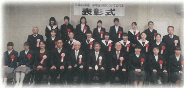
(受賞者及び表彰者)