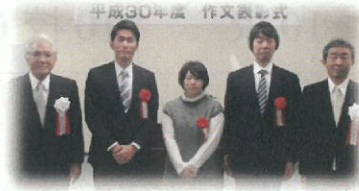
(感謝状受贈者及び表彰者)