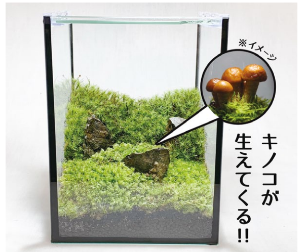
きのこリウムのイメージ例

とき 1月12日(土)～27日(日) 10:00～17:00(入館は16:30まで) ※毎週月曜日休館(休日の場合は翌平日) ところ 咲くやこの花館 1Fフラワーホール (鶴見区緑地公園2-163) 費用 大人:500円(ワークショップ一部有料) ※中学生以下、障がい者手帳等をお持ちの方(介護者1名を含む)、大阪市内在住の65歳以上の方は無料【要証明(生徒手帳、健康手帳、敬老優待乗車証等の原本)】 問合せ 咲くやこの花館 ☎6912-0055 FAX6913-8711