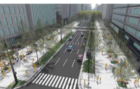
御堂筋の側道歩行者空間化イメージ▶