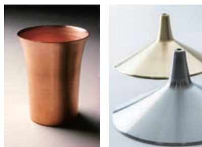
▲ 銅製のピアジョッキ ▲ 照明シェード