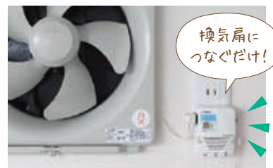
▲Auto Refresh (オートリフレッシュ)