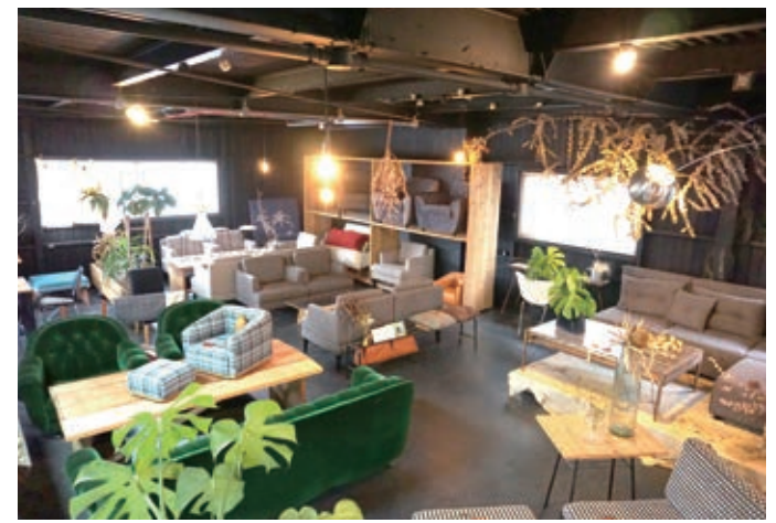
▲2階のショールーム。たくさんのソファや椅子が並び、見ているだけでも楽しい。