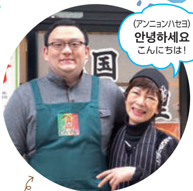
お店の前で息子さんとお二人はとっても仲が良い