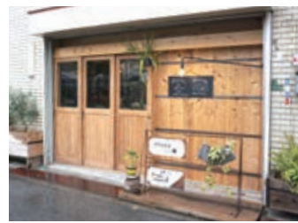
▲入口はシャッターを取り外して温かみのある木製の引き戸に変更。